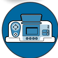
מערכת ממשק משתמש אינטראקטיבית