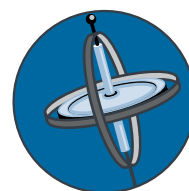
מערכת ניווט ג'ירוסקופית