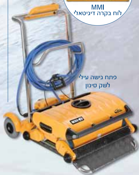
פתח גישה עליל לשק סינון

מיטרוניקס קיבוץ יזרעאל 19350 www.maytronics.com